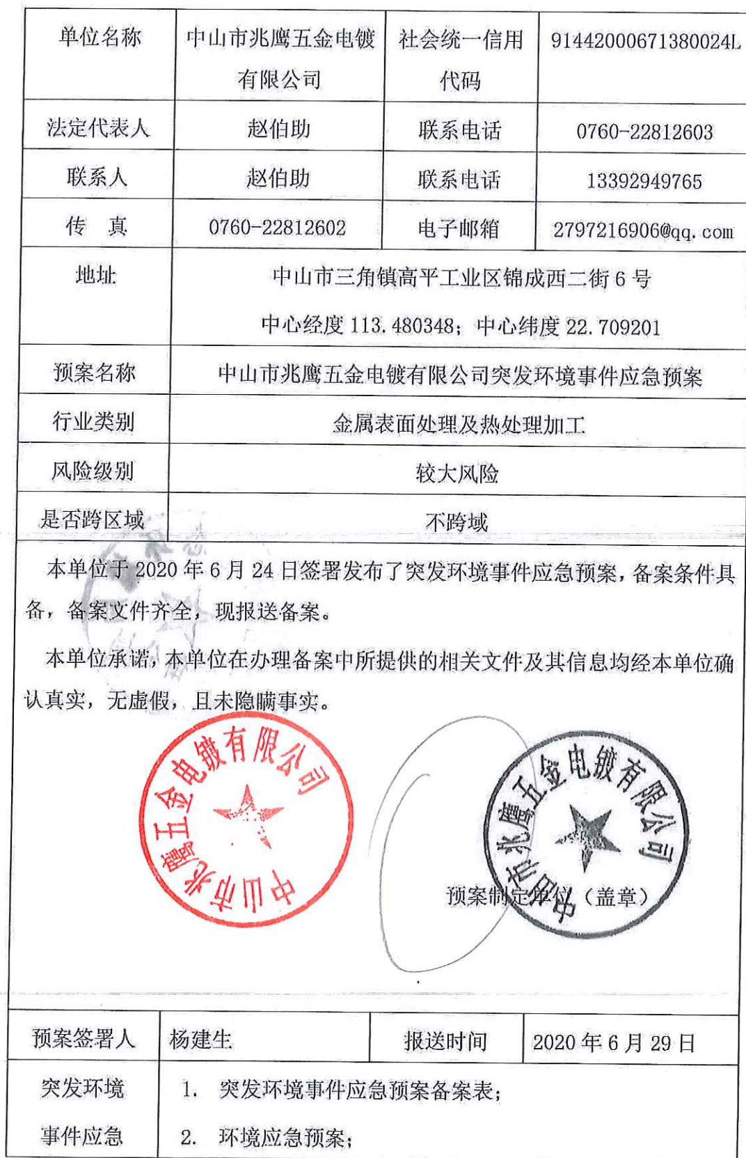
企业事业单位突发环境事件应急预案备案表