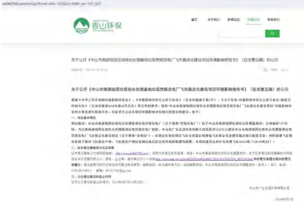
图 5.1 征求意见稿网上公示截图