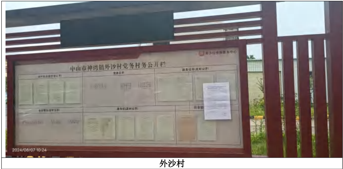
外沙村 图 5.4 现场公示照片